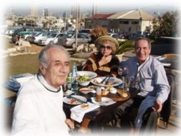
На набережной Тель-Авива (2004 г.)