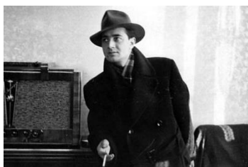
Анатолий Алексин в молодости

то на одном из них декламировал свои стихи. Прослушав стихи, Маршак сказал: «А Вы чем-нибудь другим не хотите заниматься?» Тогда удручённый «семинарист» решился прочитать рассказ собственного же сочинения – трагический по содержанию, но юмористический по форме. Рассказ произвёл впечатление на всех присутствующих, включая Самуила Яковлевича, расхохотавшегося до слёз и давшего рекомендацию начинающему литератору писать только прозаические произведения. В этой же аудитории находился Паустовский, который предложил Алексину свои редакторские услуги.