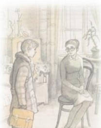
худ. Г. Мазурин

Отдельным мероприятием может стать интерактивное чтение книги на тему «Легко ли быть подростком?» Познакомившись с отрывками из произведений, следует обсудить актуальные для подростков темы и вопросы: