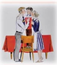
рис. В. Гальдяева

- Введение детей в основные темы и идеи произведения: семья, взаимоотношения между родственниками, любовь, общение и др.