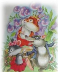
худ. И. и В. Пустоваловы

Думается, что можно найти немало книг подобной тематики – например, сказка «Мыльные пузыри» Е. Пермяка, но в нашем случае это будет сборник сказок Татьяны Комзаловой «Повелитель мыльных пузырей» для самостоятельного чтения детьми младшего школьного возраста. Эти короткие сказки-рассказы напоминают произведения В. Сутеева, Г. Циферова, А. Усачева, С. Козлова. Сюжеты сказок просты, ненавязчивы, и в то же время динамичны и поучительны.